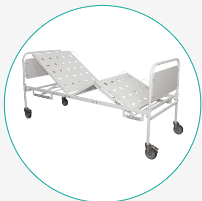
Кровать функциональная трёхсекционная КФВ-2