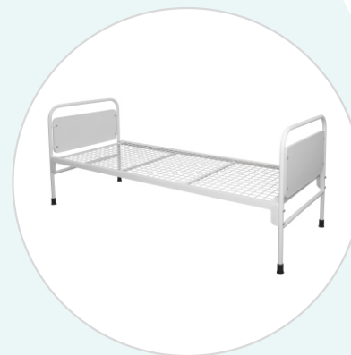
Кровать общебольничная КО-«ДЗМО»