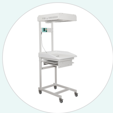
Стол для санитарной обработки новорождённых АИСТ-2