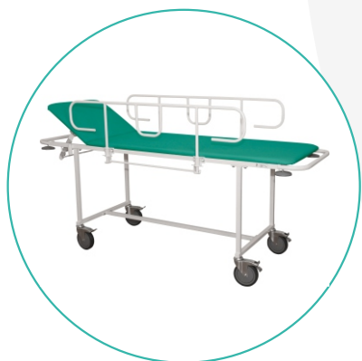
Тележка для перевозки больных внутрикорпусная ТПБВ-01 «Д»