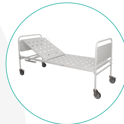
Кровать функциональная двухсекционная КФВ-1