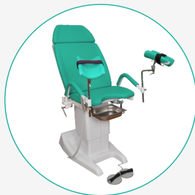
Кресло гинекологическое КГ-6