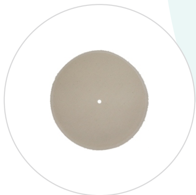
Фильтр к коробкам стерилизационным круглым КФ-3