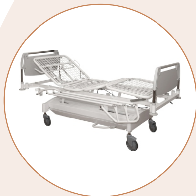
Кровать медицинская многофункциональная механическая К-ДЗМО-2-4-Г