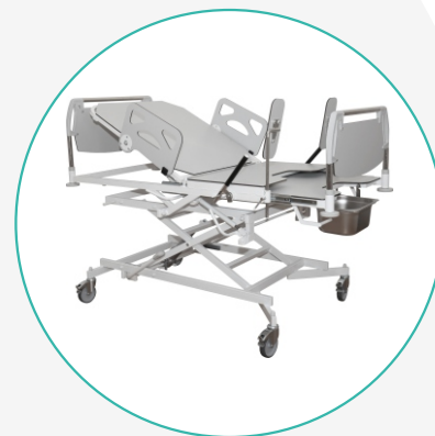
Кровать акушерская КА-3