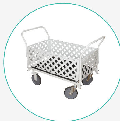
Тележка внутрикорпусная ТБК-2