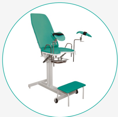
Кресло гинекологическое с ручным приводом КГ-1