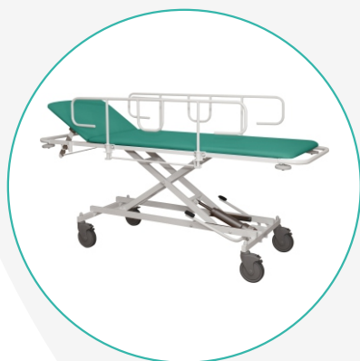
Тележка для перевозки больных внутрикорпусная ТПБВ-02 «Д»