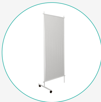
Ширма одно-трёхсекционная с полимерными полотнищами ШП 1/3-«ДЗМО»