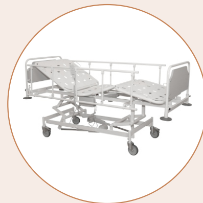
Кровать медицинская KM-2 «ДЗМО»