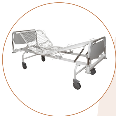
Кровать медицинская многофункциональная механическая К-ДЗМО-1-4-Р