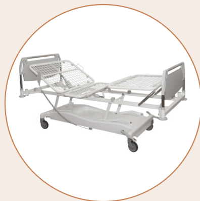
Кровать медицинская многофункциональная механическая К-ДЗМО-3-4-Э