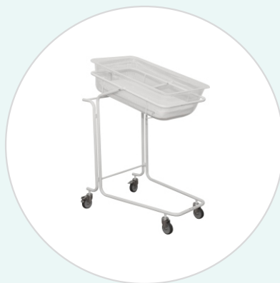
Кровать для новорождённых КН-1