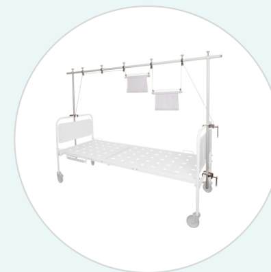
Установка для лечения вытяжением переломов верхних и нижних конечностей УВК-«ДЗМО»