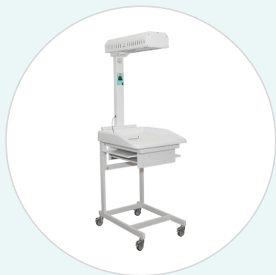
Стол для санитарной обработки новорождённых АИСТ-1