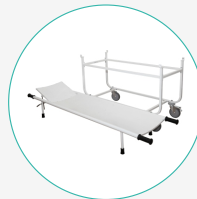
Тележка для перевозки больных, со съёмной панелью ТБС-01