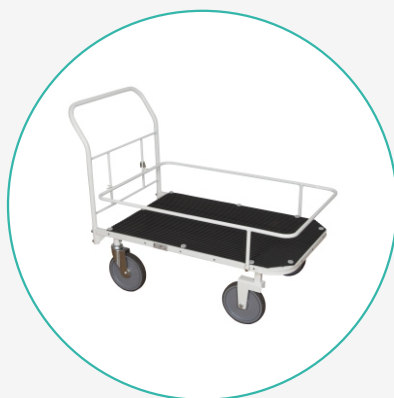
Тележка внутрикорпусная ТБК-1