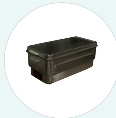
Кипятильник дезинфекционный электрический автоматический однорежимный КДЭА1-4