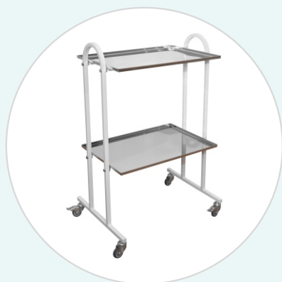
Столик инструментальный СИ-5 (2 или 3 полки)