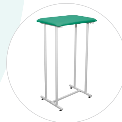
Столик для забора крови СЗК-«ДЗМО»