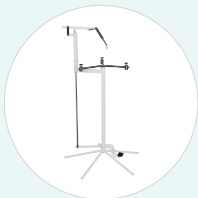
Подставка для стерилизационных коробок (биксов) ПСК-«ДЗМО»