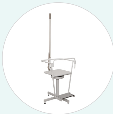
Кресло вращающееся медицинское КВ-ДЗМО