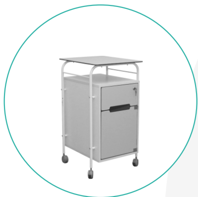
Тумбочка прикроватная ТП-1