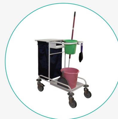
Тележка для уборки помещений ТУП