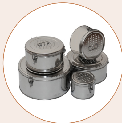
Коробки стерилизационные круглые с фильтрами KF-3/6/9/12/18