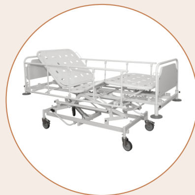
Кровать медицинская KM-1