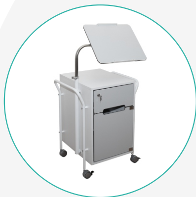
Тумбочка прикроватная ТП