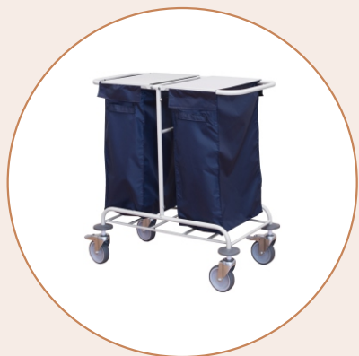
Тележка для перевозки грязного белья ТПГБ