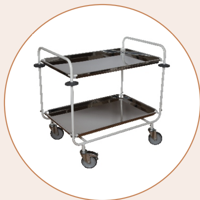
Тележка для доставки в палату пищи и сбора грязной посуды ТПП-1