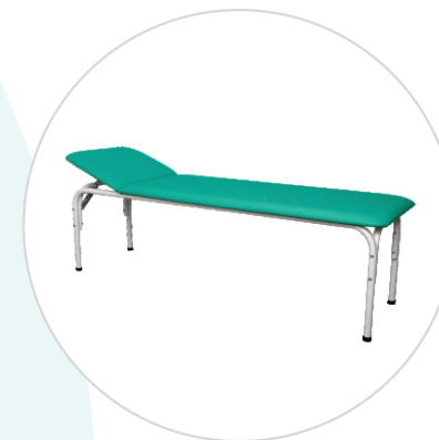
Кушетка медицинская смотровая КМС-1