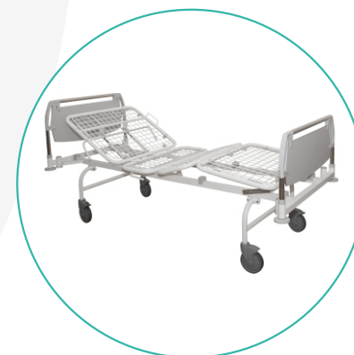
Кровать медицинская многофункциональная механическая К-ДЗМО-1-4-Г