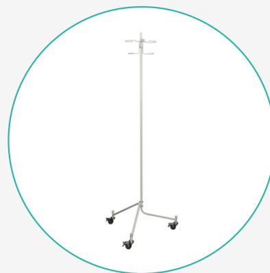
Штатив для длительных инфузионных вливаний ШВ-«ДЗМО»