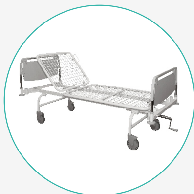
Кровать медицинская многофункциональная механическая К-ДЗМО-1-2-В