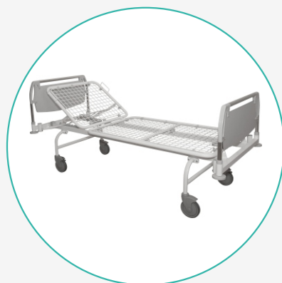
Кровать медицинская многофункциональная механическая К-ДЗМО-1-2-Р