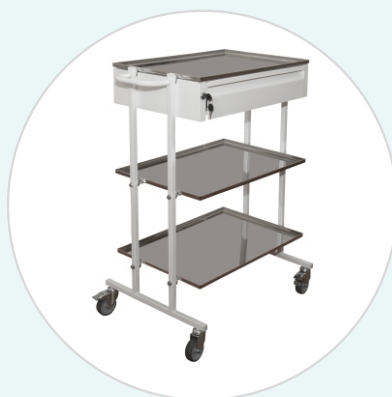
Столик манипуляционный СМ-3