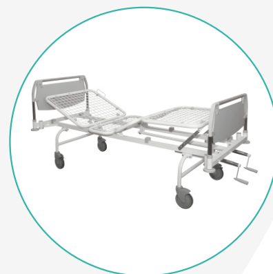
Кровать медицинская многофункциональная механическая К-ДЗМО-1-4-В