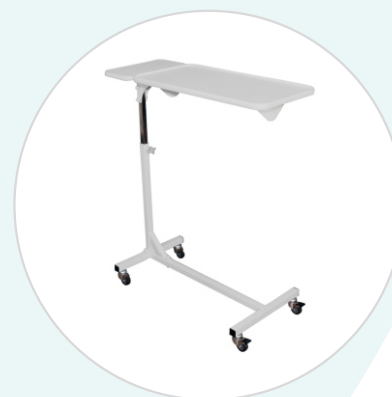
Столик надкроватный СН-03-«ДЗМО»