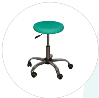
Табурет медицинский ТМ-1 «ДЗМО»