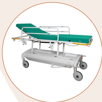
Тележка медицинская для перевозки больных Т-ДЗМО-2-2-Г