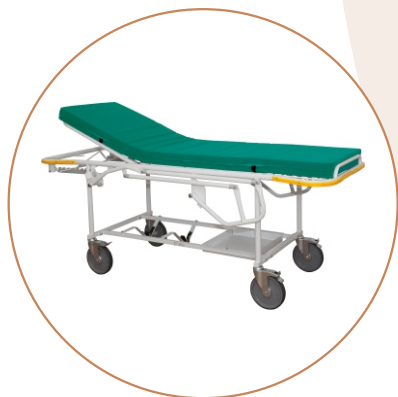
Тележка медицинская для перевозки больных Т-ДЗМО-1-2-Р