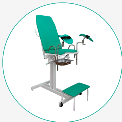
Кресло гинекологическое КГ-3М