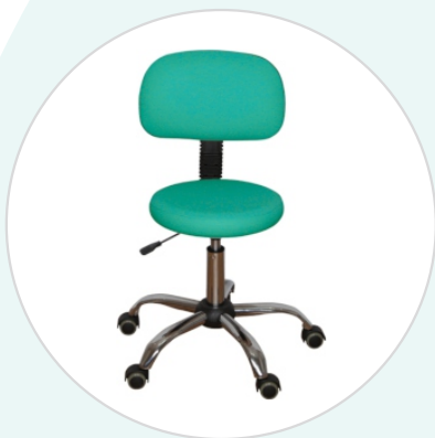
Стул медицинский СМ-1 «ДЗМО»