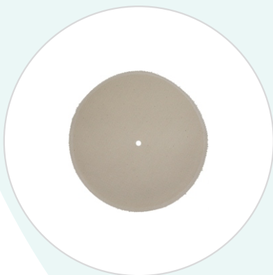
Фильтр к коробкам стерилизационным круглым КФ-6-18