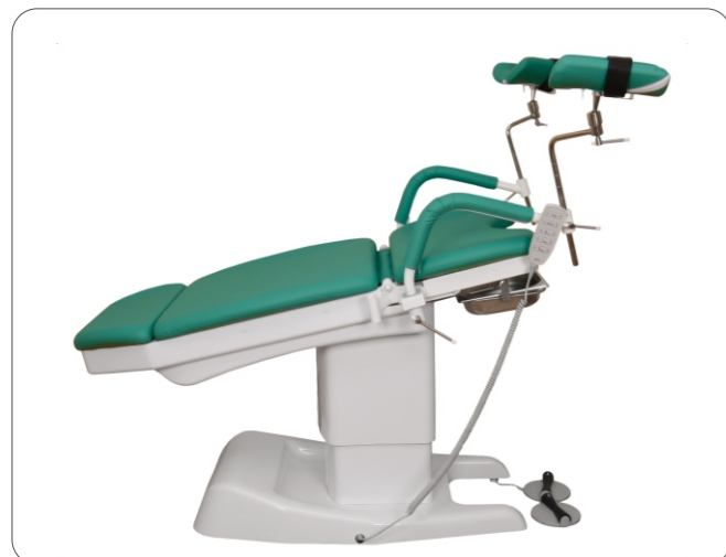
Кресло устанавливается в положение «Тренделенбург» для экстренной помощи пациентке в шоковом состоянии