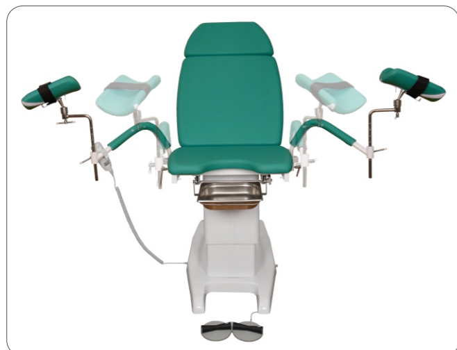
Синхронное раздвижение подколенников экономит время и гарантирует комфортную работу врача