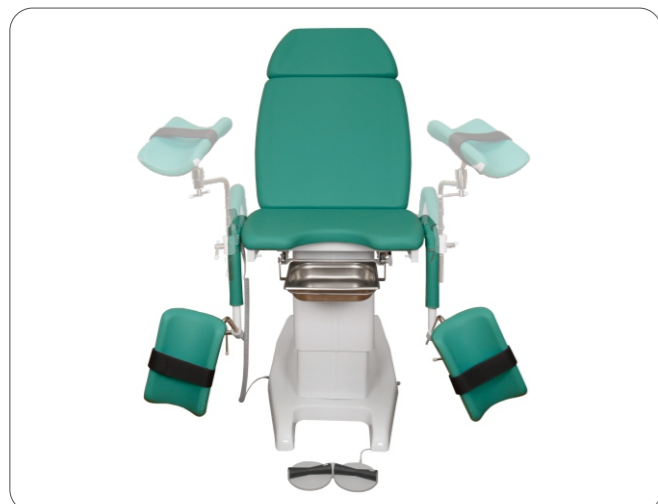
Электрическая регулировка высоты подколенников обеспечивает лёгкость посадки на кресло пациенткам с низким ростом или пожилого возраста (опция)

Для предотвращения произвольного движения и повреждения ног пациентки, подколенники укомплектованы ремнями