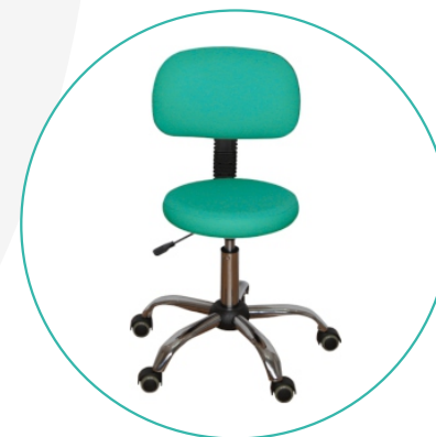
Стулья и табуреты