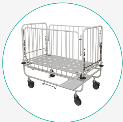
Кровати функциональные детские