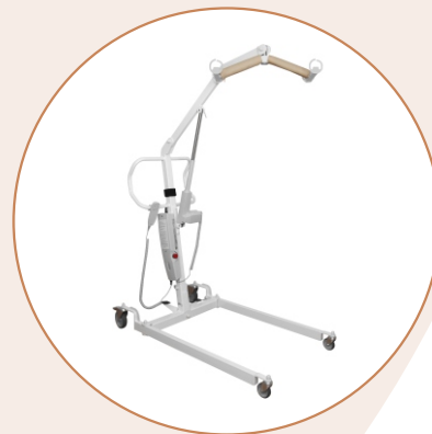
Подъемники для перемещения пациентов