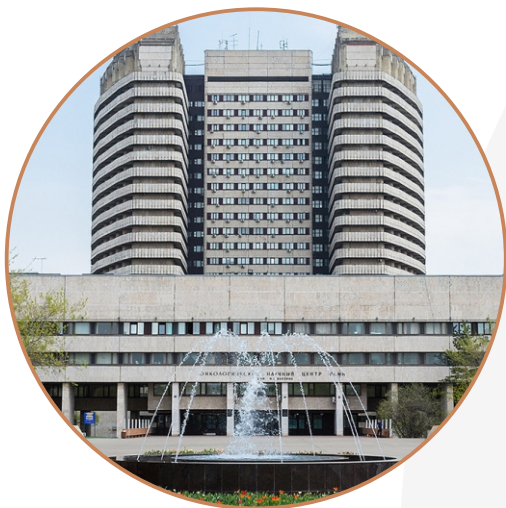
ФГБУ «НМИЦО им. Н.Н. Блохина» Москва