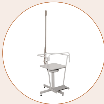
Вращающиеся медицинские кресла (Барани)