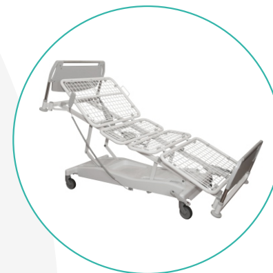
Кровати функциональные взрослые