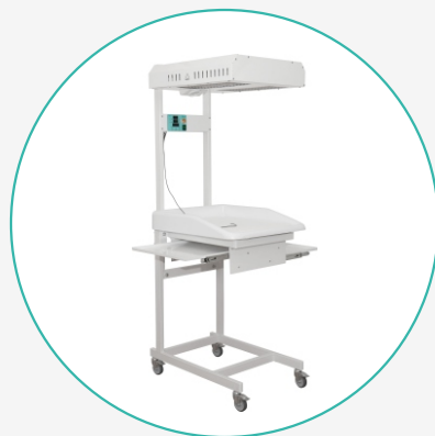
Стол для санитарной обработки новорождённых