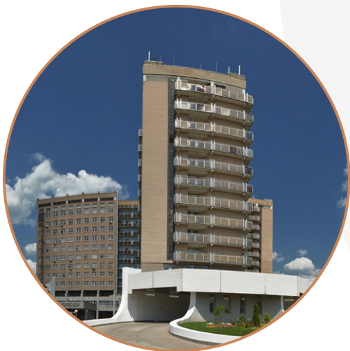
ФГБУ «ЦВКГ им. А.А. Вишневского» Москва