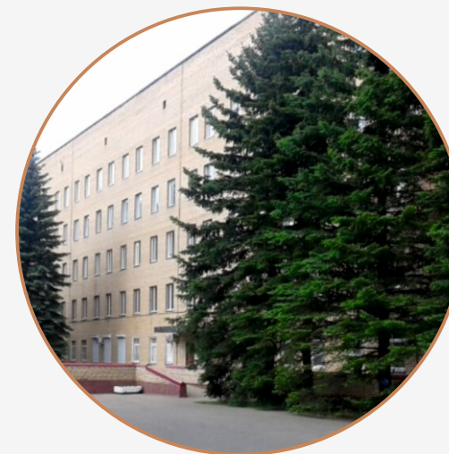
ФГБУЗ «ЦКБВЛ ФМБА» Москва