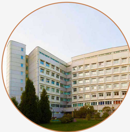
ГБУЗ «ГКБ им. В.В. Вересаева» Москва