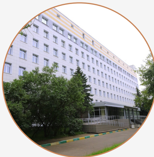
ГБУЗ «ГКОБ № 1» Москва