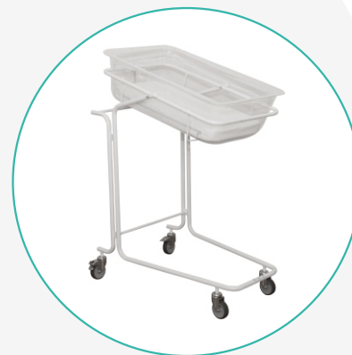
Кровати для новорождённых