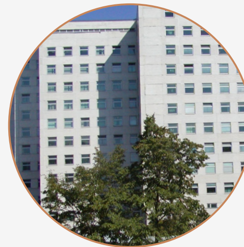
«МОНИКИ им. М.Ф. Владимирского» Москва